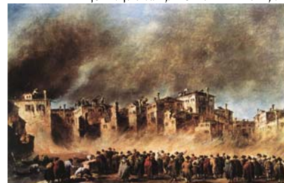
גוארדי, "שריפה במפעל לשמן זית בסאן מרקואולה", 1789, שמן על בד, 42X62 ס"מ,