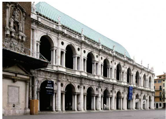
בזיליקה פאלאדינה, פאלדיו, 1549, הושלמה לאחר מותו ב1614, וינסונה.