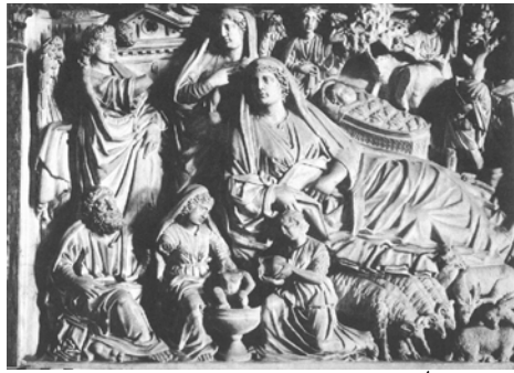
בית הטבילה, פרט: יוס הדין.