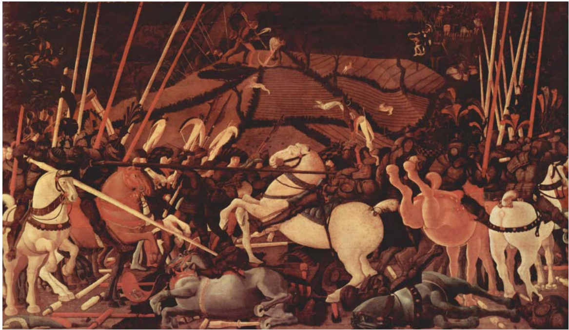
קרב רומאנו, פאולו אוצ'לו, 1438, 182X323, גלריה דלהי אופיציי, פירנצה.