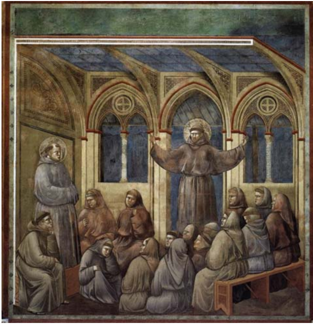
כנסיית סן פרנססקו הקדוש באסיסי, ג'וטו, פרסקו, (Giotto 1267-1335)