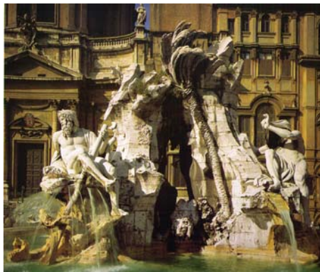
המזרקה בפיאצה נאבונה, ברניני, שיש ואבן טרוורטין, 1651-1648, רומא.

מכל הנסיעות המאוחרות שלי באיטליה המשעשעת והעצובה גם יחד הייתה הניסיון לרדת שוב דרומה מרומא לנאפולי, הפעם במכונית שכורה ובתקווה שאוכל לבקר גם בפומפיי. אבל איכשהו סטייתי מהדרך ועד שעליתי שוב לכביש הראשי כבר היה ערב. לצערי חזרתי על אותה טעות למחרת; שטות שאיני מבין אותה אלא אם מישהו חמד לו לצון באותו יום והפך את כיוון השלטים. בסופו של דבר התייאשתי ובמקום זאת עליתי על המעבורת ל-קאפרי, מקום בו ראיתי סוף סוף את הווילה סן מיקלה נושא סיפרו של ד"ר אקסל מונטה, שכבר הזכרתי במבוא.