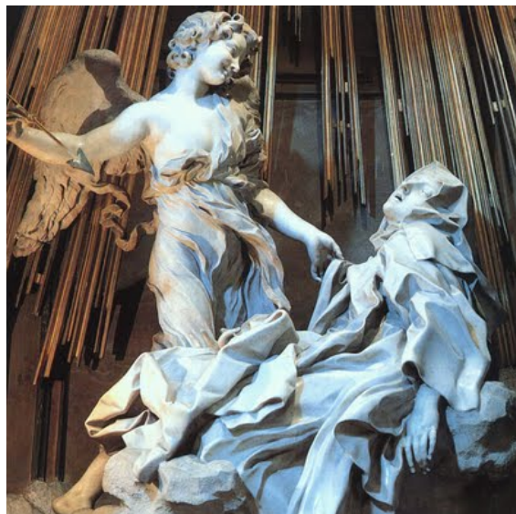
האקסטטה של ס' טרזה, ברניני, שיש, 150 ס"מ גובה, 1647-52, כנסיית ס' מריה דלה ויטוריה, רומא.