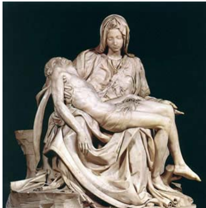
הפייטה: מיכאלאנג'לו, שיש, 1498, 1.74 X 1.95 מטר, כנסיית ס' פטר.