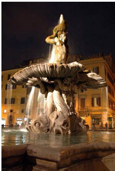
מזרקת "טרטיון", ברניני, שיש ואבן טרוורטין.