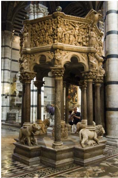
ניקולה פיזאנו, בית הטבילה, פיזה.