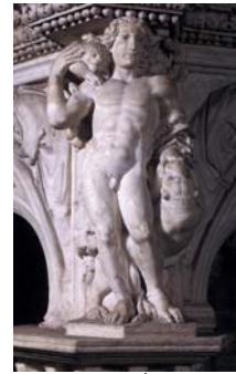
בית הטבילה, פרט: דמות.

מהביקור האחרון ברומא זכורים לי בעיקר פסל "הפייטה" של מיכאלאנג'לו הניצב בכנסיית ס' פטר, והמיזרקות של גיאנלורנצו ברניני (Bernini 1598-1680) הפזורות בכל העיר למשל מזרקת הטרטיון ושלוש תמונות של קאראווג'ינו בכנסיית סנט לואיג'י דל פראנססקו: "קריאת ס' מתיו", "ס' מתיו והמלאך" ו"עינויי ס' מתיו". את כנסיית ס' קרלו אלא קוואטרו מונטאנה של פראנססקו ברומיני, את ה"טמפייטו ס' פיטר" של דונאטו בראמאנטה (Bramante 1444-1514), בנין שהוא לכאורה קטנטן אבל למעשה אבי חלק ניכר שכל כיפות הכנסיות שנבנו מכאן ואילך ברחבי אירופה. כמובן שעשיתי לרומא עוול עם רשימה קצרה זו שאינה כוללת עוד עשרות יצירות מופת רובן מוכרות אולי מוכרות מדי כאתרי תיירות.