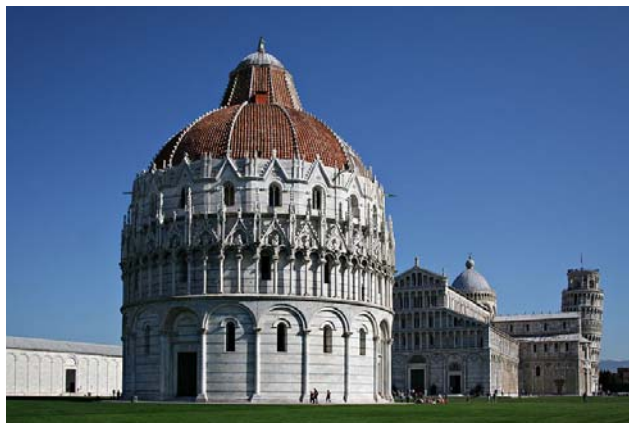
בית הטבילה והמגדל הנטוי. 1255. ניקולה פיזאנו. פיזה.

אמני רומא Francesco Borromini 1599-1667 Caravaggio 1571-1610