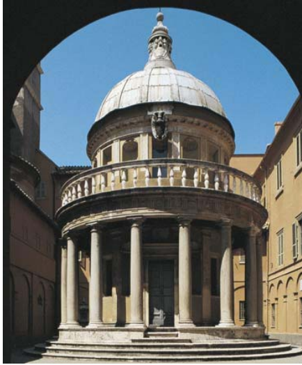
טמפייטו ס' פיטרו, דונאטו בר אמנטה 1508.