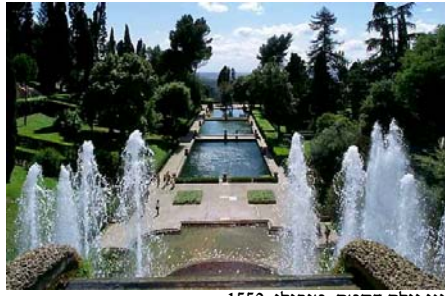
גני וילה דסטטה, טיבולי, 1550.