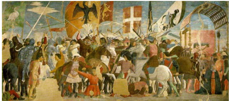
"הקרב בין הרקולס וקוסארוס", פיירו דלה פראנציסקה, פרסקו, 747X329 ס"מ, כנסיית ס' פראנססקו, ארצו, 1466.

את הכיכר של סיינה שהתפרסמה, בין השאר, בזכות האדריכל האמריקאי פול רודולף ששילב את אותה צורת מניפה באחת מתוכניותיו. באותו מרחב, קרוב יותר לרומא, ביקרתי בכנסיית פראנציסקו הקדוש בעיירה אסיסי. וכמו כל אוהבי האמנות תהיתי האם ציורי הקיר בקתדרלה הם אכן של ג'וטו שהיה לכאורה צעיר מדי כאשר בוצעו. בנסיעה ל-טיבולי, הסמוכה אף היא לרומא התרשמתי מהניגוד בין גן המיזוקות המופלא לעומת הבניין הקטן, יחסית, של הארמון עצמו. בדרך חזרה ראיתי, איך אפשר שלא? את מתחם ארמון הקיסר האדריאנוס (משל 117-138) שהיה מעיין ורסאי של העת העתיקה.