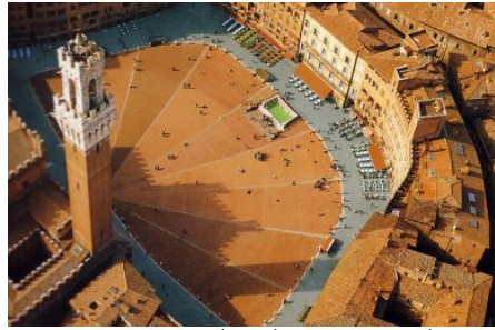
כיכר דל קמפו בסיינה, פול רוזולף.