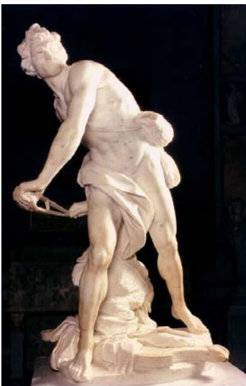
"דוד", ברניני, 1623, שיש רקארה גובה: 1.7 מטר, גלריה בורגז, רומא.