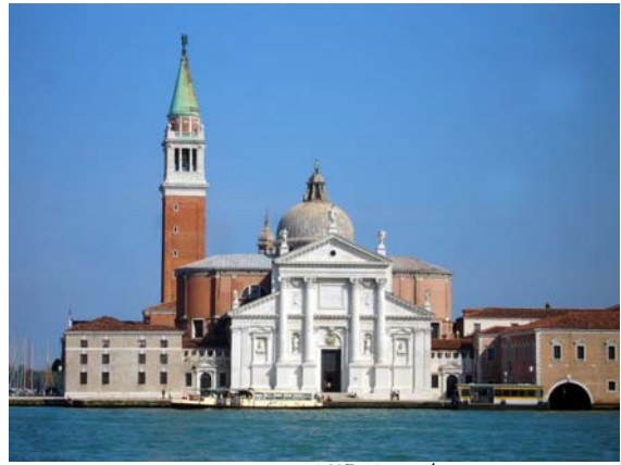
כנסיית סנט ג'ורג' פאלאדיו, 11-1607.