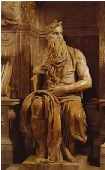
מיכאלאנג'לו: "משה", 1515, שיש, גובה 35.2.