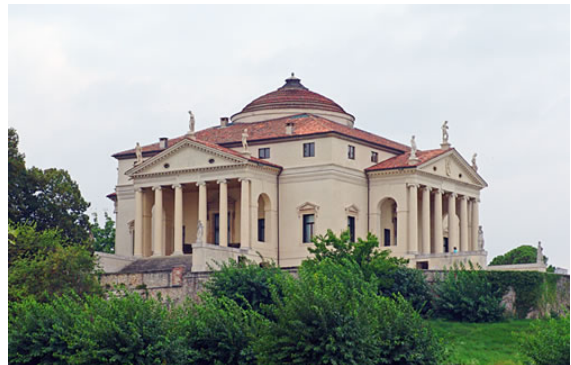
וילה רוטונדה, אנדראה פאלאדיו, וינסונה, 1566, הושלמה אחר מותו-1585 על ידי וינסנו סקמוצי.