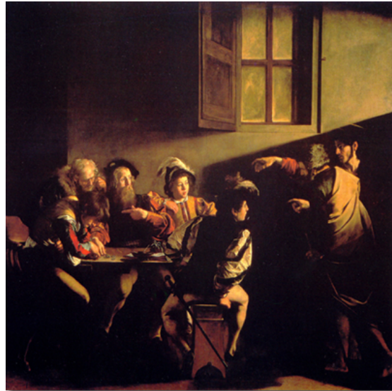
"קריאת סנט מתייו", קארוואג'יו, 1599, 340 X 322, שמן על בד, כנסיית סאן לואיג'י.