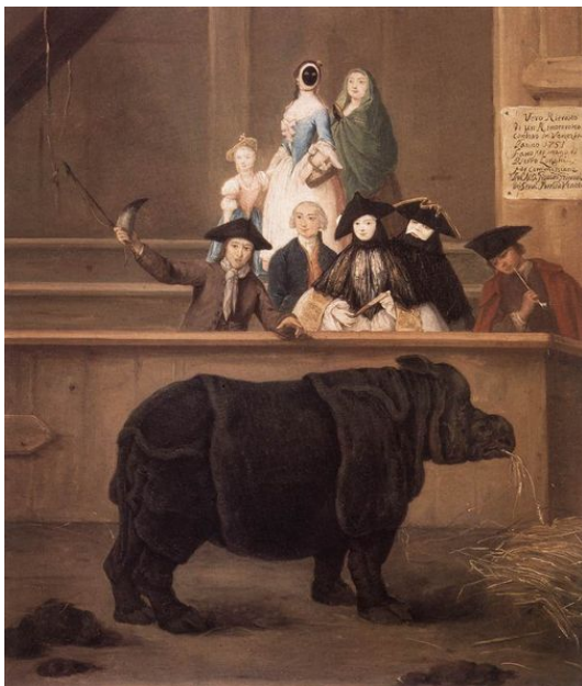
פיטרו לונגי, "הקרני", 1751.