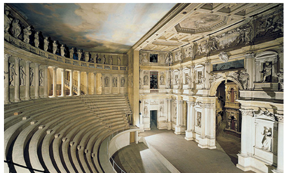
התיאטרון, פאלדיו, 1580, הושלם על ידי וינסנו סקמוצי ב1585, וינסונה.