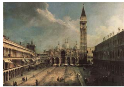
קאנאלטו, "פיאצה סאן מרקו", 1723-24, שמן על בד, 141.5X204.5 ס"מ, מוזיאון תייסן-