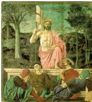
"התחיה", פיירו דלה פראנציסקה, פרסקו וטמפרה, 200X225 ס"מ, אוסף המוזיאון של סאנספולרו, עיירת מולדתו של פיירו דלה פראנציסקה, 1450.

Piero dela Francesca 1416-1492 Nicola Pisano 1223-1284